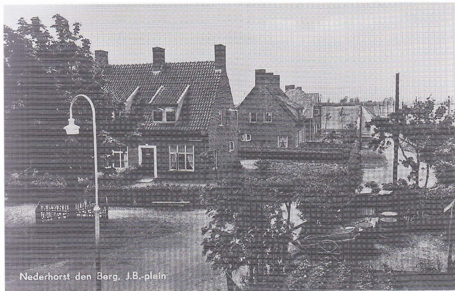
Nederhorst den Berg, J.B.-plein