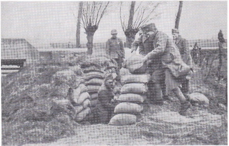
Mobilisatie 1939-1940: Stellingbouw in de vesting Holland

Pas tijdens de Duitse aanval in de meidagen van 1940, toen het gevaar dreigde van Duitse oversteekpogingen vanuit Friesland over het IJsselmeer naar Noord-Holland, werd het zgn. noordfront van de Vesting Holland (dit was het noordelijk deel van de voormalige Stelling van Amsterdam, zie kaartje) in staat van verdediging gebracht. Voor het eerst in de geschiedenis van de Stelling werden nu ook in dit deel de inundaties daadwerkelijk uitgevoerd. Toch was het duidelijk dat door de moderne oorlogsvoering, zoals de massale inzet van vliegtuigen en luchtlantingstroepen, de vroegere Stelling zijn militaire betekenis had verloren.