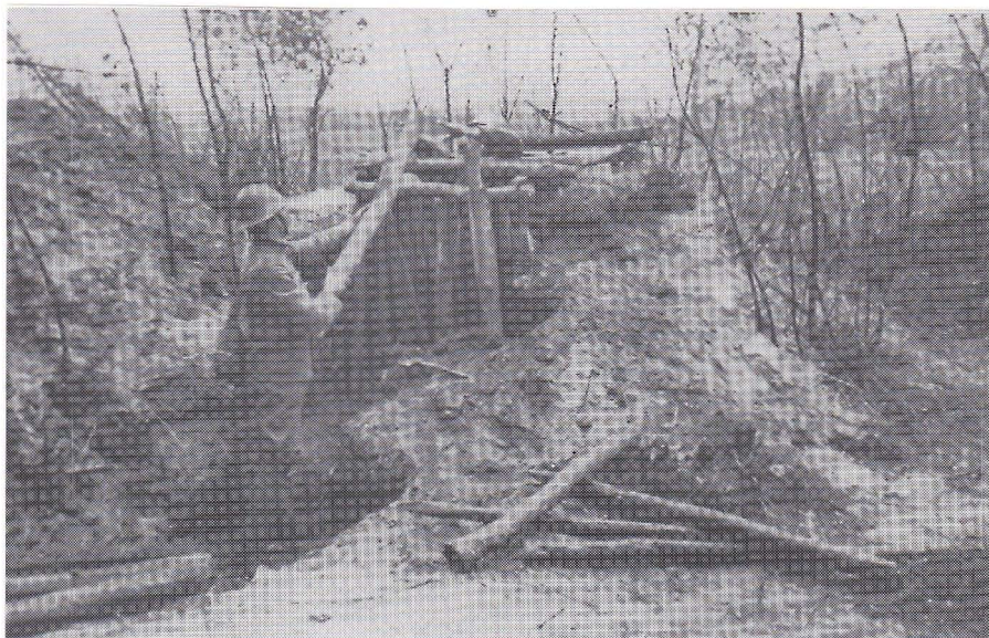
Mobilisatie 1939-1940: Stellingbouw in de vesting Holland

bijzondere planten voor, die zeldzaam zijn geworden in het agrarische cultuurlandschap. Ook is de Stelling op veel plaatsen een toevluchtsoord geworden voor uit veel soorten vogels bestaande broedvogelgemeenschappen.