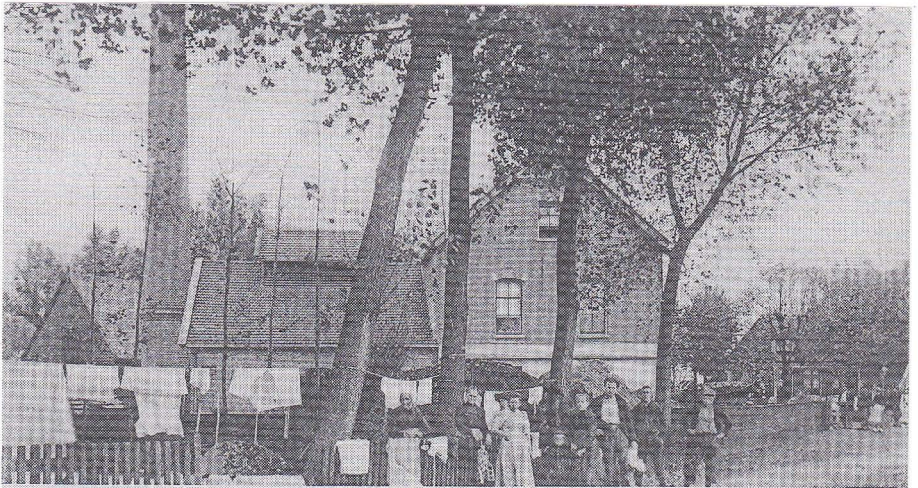
Nederhorst den Berg