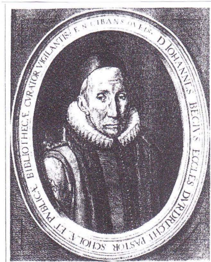
Fig. 2. Johannes Becius, predikant te Dordrecht 1626 (naar 8).

Deel van de Gedoopte Gelyk kinden also anders hoonz en die namen der Ouders Namen der kinderen. Des 19 en Mey Anno 1639. Gijsbertgen Paludanus. Namen der ouders. Rutgerus Paludanus Predicant tot Nederhorst.