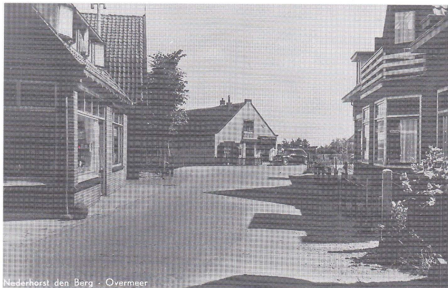
Nederhorst den Berg · Overmeer