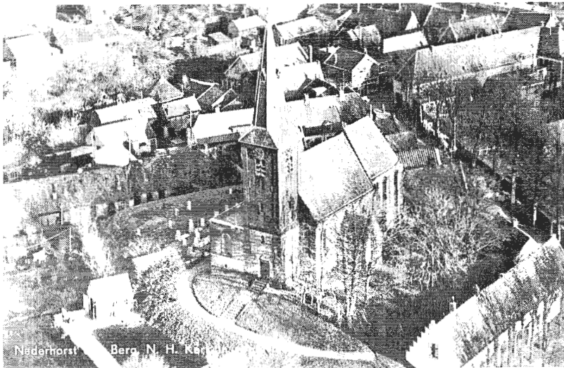
N.H. Kerk met Algemene Begraafplaats rond 1950