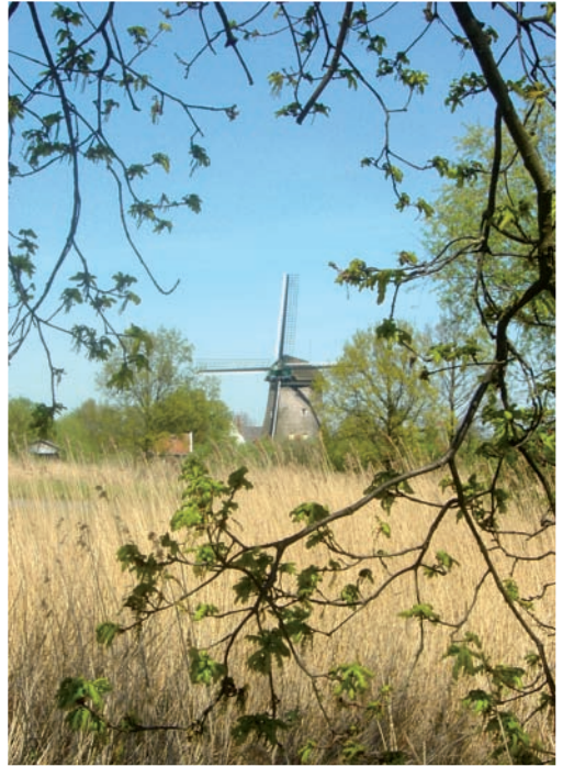
De molen vanaf het wandelpad rond de Blijkpolder.

De zaak floreerde toch kennelijk goed, want in 1938 besloten ze een huis aan de stal te bouwen. Mam, die de molen in het begin van haar huwelijk vooral gezellig en knus had gevonden, zal er blij mee zijn geweest. Ze ging zich, omdat ze nogal netjes was, op den duur ergeren aan de onuitroeibare stof die uit alle onmogelijke hoekjes en gaatjes kwam. Daarnaast was ook de woonruimte in de molen, met de groeiende kinderschaar, vooral onhandig en veel te klein.