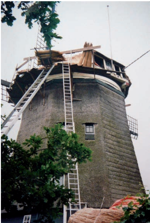
Eén van de vele restauraties.

De loten à twee kwartjes per stuk vonden grif kopers. Prinses Juliana en prins Bernhard droegen ook iets bij, vertelde Schimmelpenninck, zodat op de begroting voor het opknappen van de molen zelfs een klein overschot te zien was. De loterij had 1.280 gulden opgebracht;