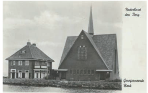
Ansicht Gereformeerde Kerk.

School met den Bijbel, die bijna naast de kerk stond. We zijn er verder in geslaagd alle namen van de resterende jongens en meisjes te weten te komen. In totaal telde de Gereformeerde Kerk in die jaren gemiddeld twintig catechisanten per