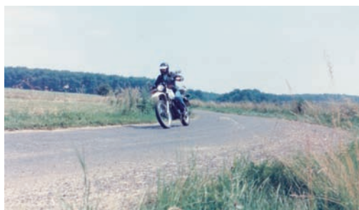
Olaf helemaal alleen op zijn motorfiets.

Op 3 januari 1982 was er bij WSV de Spiegel in clubhuis 'het Boordlicht' de Nieuwjaarsborrel. Iedereen stond er met een glas champagne in de hand toen we het plan lanceerden om vanuit de redactie van de Spiegeling een loop rond de Spiegelplas te organiseren. Dit was nog nooit eerder gebeurd in Nederhorst den Berg. De meeste receptiebezoekers waren meteen reuze enthousiast en beloofden onmiddellijk met de training te starten.