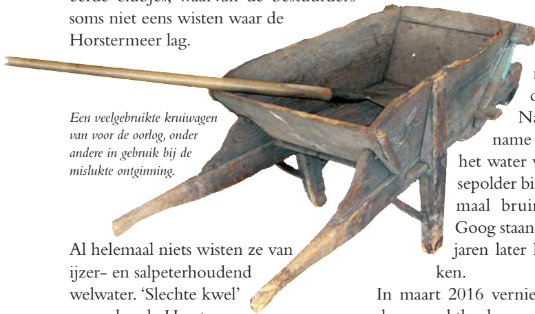
Een veelgebruikte kruitwagen van voor de oorlog, onder andere in gebruik bij de mislukte ontginning.

In diezelfde tijd, rond 1960, schrokken de polderbewoners op door geruchten dat de Horstermeer weer voor een deel onder water gezet moest worden. Dat waren plannen van een aantal gesubsidieerde clubjes, waarvan de bestuurders soms niet eens wisten waar de Horstermeer lag.