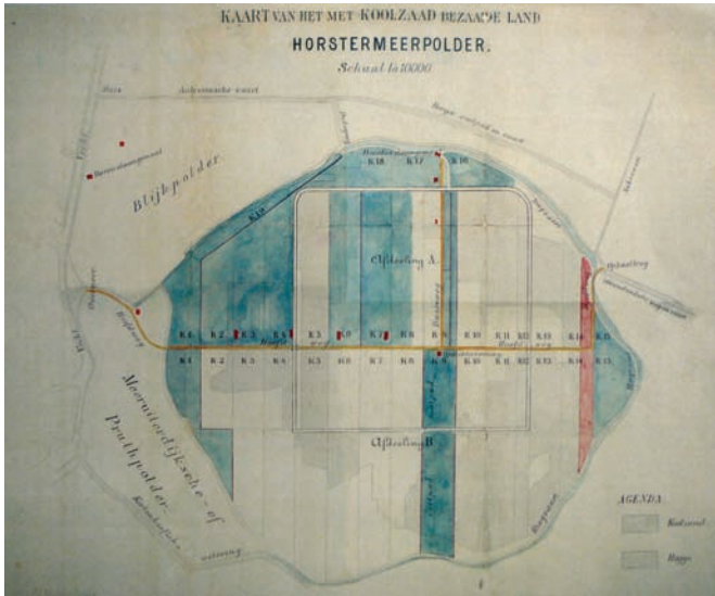
De originele kaart voor de inrichting van de Horstermeerpolder.

voor de eerste boeren die zich er vestigden. Dat kwam door de intensieve bemaling, die dag en nacht nodig was. De animo viel niet mee, maar toch doken er pioniers en doorzetters op: zeven boerderijen en een aantal groentekwekers. Het beheer en bestuur van de polder kwamen in handen van ‘De Horstermeerpolder’, die de Keur als handleiding voerde. De Keur is een verordening met de regels die een waterschap hanteert bij de bescherming van waterkeringen,