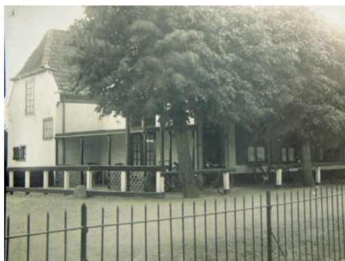
Café Overmeer rond 1930.