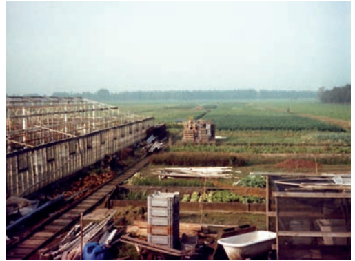
De kas in aanbouw heeft Klaas helemaal zelf gebouwd.

Er was een bloemenveiling op het Langgewenst in Hilversum, maar die werd te klein. Toen kwam in 1970 de bloemen- en groenteveiling aan de Nieuwe Haven in Hilversum in gebruik. Inmiddels werden ook al veel bloemen en potplanten