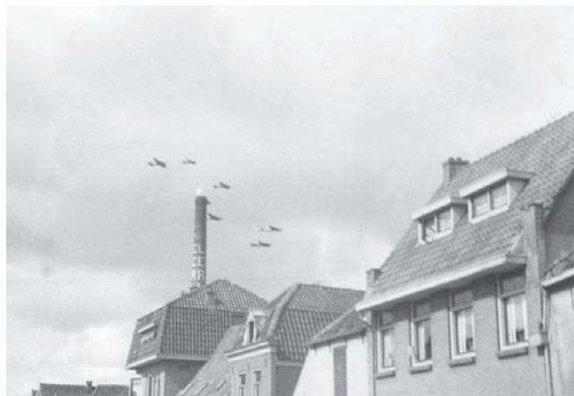
Vliegtuigen boven de Breedstraat in Weesp. De schoorsteen is van melkfabriek 'Neerlandia'.

de 16 en 40 jaar moesten zich melden om in Duitsland te gaan werken. Daar was natuurlijk weinig animo voor. Toen begonnen de Duitsers met hun geveesde razzia's. Net op tijd wist ik Weesp uit te vluchten. Bij de niet meer werkende wasserij waar mijn vader normaal werkte was ergens op een zolder wel een plek waar ik me kon verstoppen.