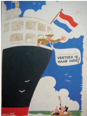
In december stuurde Bram zo'n Ansichtkaart naar zijn vader en moeder. Defensie verstreekte de kaarten gratis, zodat de familie de datum vrij kon houden.

maten zo'n beetje door zoals ze zelf wilden. Hun superieuren hadden niet zo gek veel greep meer op die oud-strijders.