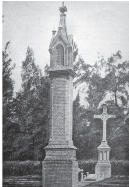
Het kerkhof omstreeks 1910. Tussen het kruis en de dodenlantaarn het praalgraf van pastoor Vismans. De dodenlantaarn werd in 1937 afgebroken, het praalgraf verdween in de jaren tachtig.