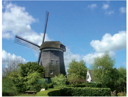
De uit de boom gezaagde zitbank.

centratiekampen terecht, maar overleefde Dachau. Later restaureerde hij samen met anderen in het clubje 'Vrije Vogels' oude, afgedankte vliegtuigen.