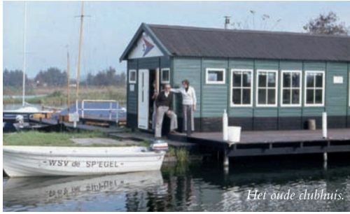
Het oude clubhuis.