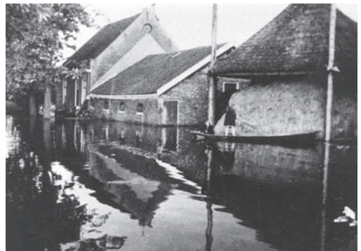
Inundatie rond Weesp. Lange Muiderweg, april 1945.

Toch moest en wilde ik weer naar Amsterdam maar de oorlogstoestand werd wel steeds grimmiger. Engelse vliegtuigen probeerden ook het treinverkeer uit te schakelen en schoten de stoomketels van de locomotief kapot. De machinist had een betonnen kist op de tender staan en daar kropen ze in als ze ergens vliegtuigen zagen aankomen. De trein stopte dan en de passagiers vluchtten het land in. Als het loos alarm was werd de reis weer voortgezet maar ik heb ook eens door de polder naar huis moeten lopen omdat de locomotief geraakt was. Op de duur werd het ook voor de machinisten