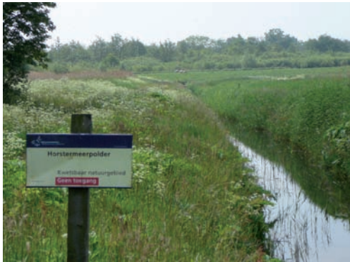
Dit natuurgebied is het gevolg van een poging tot het ontginnen van het zuidoostelijke deel van de polder. Het in opdracht van Domeinen door de Heidemij onder auspiciën van de D.U.W. (Dienst Uitvoering Werken) uitgevoerde project in de crisisjaren (dertiger jaren vorige eeuw), mislukte volledig.

In de jaren vijftig nam de teelt van wortels flink toe, doordat er een middel in de handel kwam waarmee je het onkruid in de wortels goed kon bestrijden. Zo-doende werd het telen minder arbeids-intensief en verbeterde de kwaliteit van de wortels.