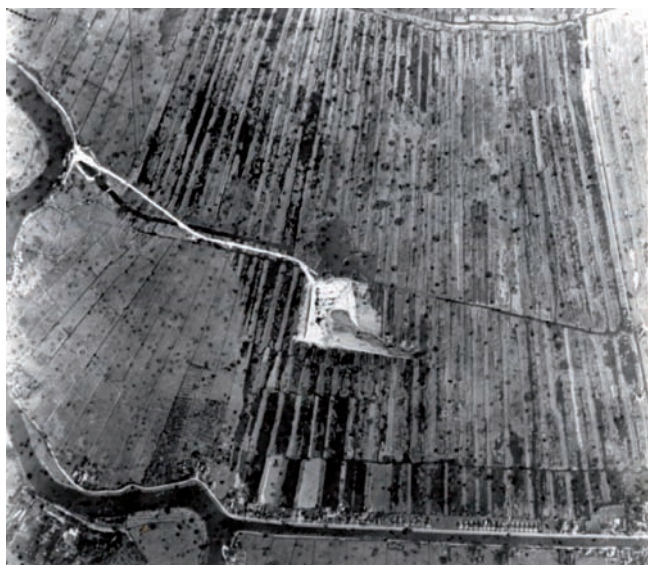
Luchtfoto uit 1936. Het kanaaltje, gegraven om de zuiger binnen de Spiegel-polder te brengen, is duidelijk te zien.

Mannen met lieslaarzen trokken iedere keer met man en macht de houten schotten uit het drijfzand omhoog als daarachter het zand een bepaalde hoogte had bereikt. Ondertussen legden anderen spoorrails aan om het zand met een treintje af te kunnen voeren. In het begin schepten een groot aantal mannen de kiepwagonnetjes met een inhoud van tien kubieke meter vol. De locomotief trok die bovenladers naar een trechter waarin ze een voor een geleegd werden. Het zand stroomde via een lopende band, die onder de Vechtdijk doorliep, in de wachtende schepen en scheepjes.