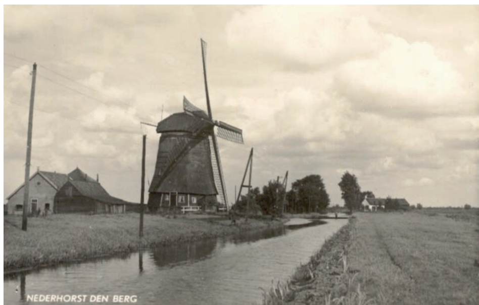
De molen omstreeks 1905.