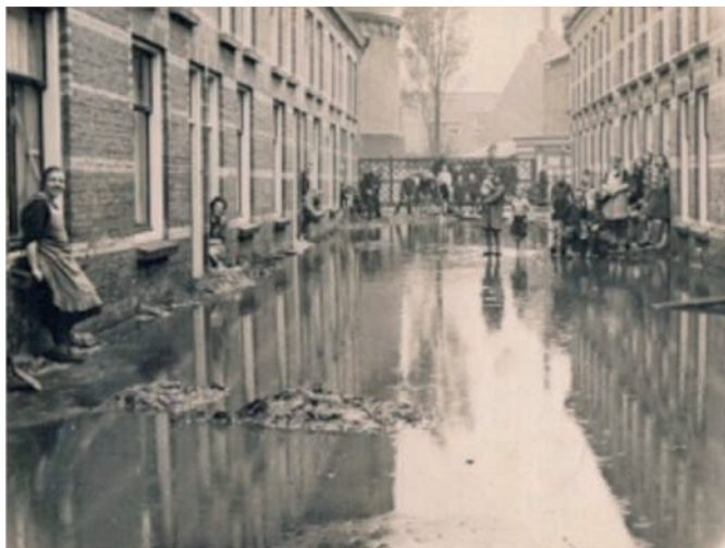
Een ondergelopen straat in de binnenstad van Weesp.

werd een eindeloze zaal ingeduwde, waar aan het eind drie bureaus stonden met daarachter drie generaals met grote petten en veel vierdaagse-lintjes op hun borst. Het scheelde niet veel of het was mij dun uit de broek gelopen. Wat ik daar voor antwoorden heb gegeven weet ik niet meer, maar wel dat ik geen geweer wilde oppakken en geen mensen wilde doodschieten. Ik wilde nu in vrijheid gaan leven. Heel lang heb ik er niets meer op gehoord. Ik zat in grote spanning, elk ogenblik kon er een legerauto voor de deur staan om me op te halen. Of 3 jaar naar Nieuwersluis of geboeid op de boot naar Indië.