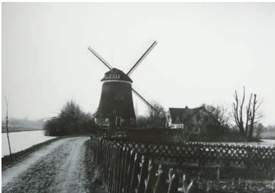
Het Ankeveensepad circa veertig geleden.