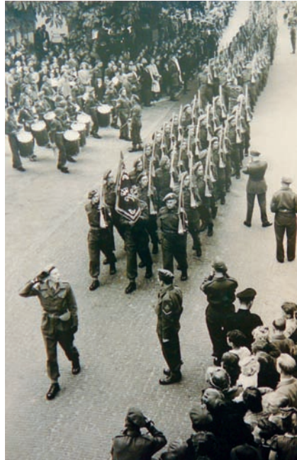
De soldaten gaan in gelid aan boord onder toezienend oog van de familie.