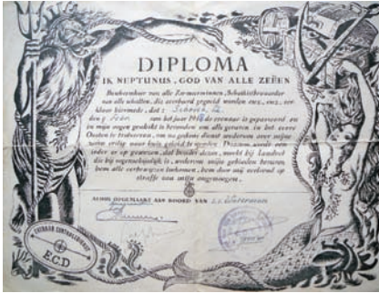
Diploma van de doop door de god Neptunus bij het passeren van de evenaar.