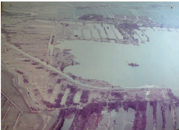
De Spiegel- en Blijkpolderplas is bijna een feit. Rechtsonder ziet u de huisjes bij De Goog. Het nieuwe fietspad is buitengewoon goed zichtbaar, aan het beloofde paradijs moet nog gewerkt worden.

De 'Baggeraar', het bescheiden door de Ballast geschonken kunstwerk in brons, mag best weer eens voor het voetlicht worden gebracht. Samen met de Kerngroep Nederhorst den Berg van de Vereniging Milieudefensie omdat die het toch voor elkaar gekregen heeft, dat een kale opgespoten hoek in de Blijkpolder is uitgeroeid tot een Paradijs. ■