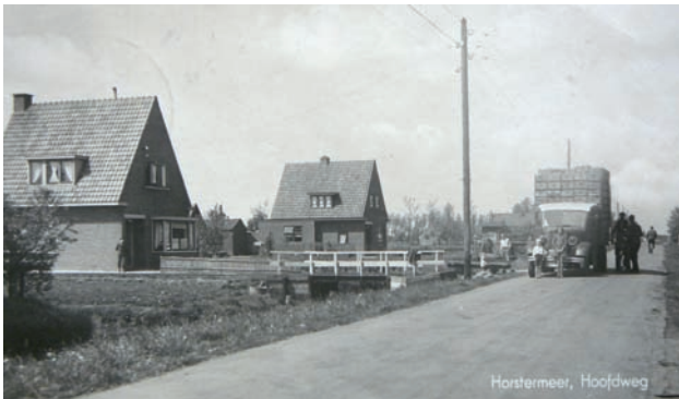
De Hoofdweg (nu Middenweg) in 1941 met de vrachtwagen van de gebr. Gons die de groente van de tuinders naar de veiling van Hilversum bracht.

moesten mooi groen zijn, voor een aantrekkelijk bordje soep. Dus was er vaak controle op de kwekerijen in de polder. Als de bietenvliegen in juni actief werden in de suiker- en voerbieten bij de bouwboeren, ging men die te lijf met bestrijdingsmiddelen. Maar in de soepgroenteteelt mocht je die middelen niet gebruiken. Soms wel vier maal per seizoen werd geoogst door af te maaien met een zeis. De bestrijdingsmiddelen die men wel kon gebruiken moesten worden ingefreesd, dus al voordat de groente gezaaid werd. Die middelen mochten niet later dan vier weken voor de oogst worden gebruikt. Als de larven van de bietenvlieg eenmaal van de wortels van de soep mee aten, werden de blaadjes binnen enkele dagen geel en mocht de soepgroente niet meer aan de soepfabriek worden geleverd. Dus hadden de kwekers vaak 'soepzorgen'.