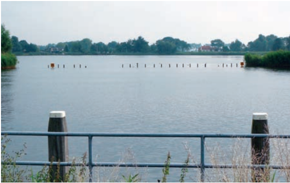
Het Gat van de Ballast, hier is het begonnen. Het is er twintig meter diep, net zo diep als de door de firma Blankevoort uitgezogen Nes achter Overmeer.

‘De Amsterdamsche Ballast Maatschappij’ drukte jarenlang haar stempel op het dorp, doordat ze vanaf 1936, met de volledige toestemming van provincie en gemeente, in de inmiddels bijna geheel aangekochte Spiegelpolder zand begon te zuigen. De ingelanden stemden eveneens toe, maar niet voordat ze bij de Ballastmij hadden bedongen dat de plas die zou ontstaan voor recreatieve doeleinden gebruikt kon gaan worden.