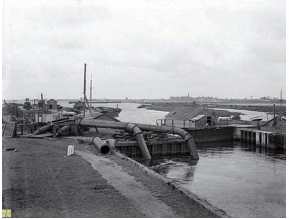
De Ballastsluis (aangelegd in 1942) volop in bedrijf in de veertiger jaren.

Vanaf 1966 kreeg de Ballast toestemming om nog eens 20 meter dieper te gaan. In het noorden