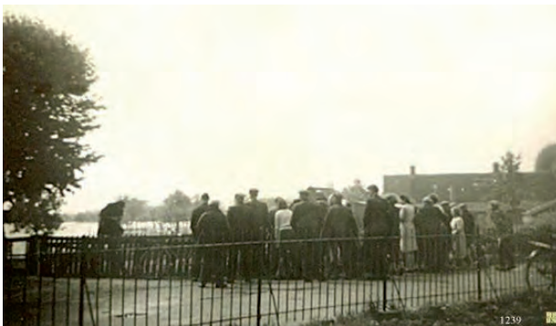
Overmeesters staan op 5 mei te kijken naar de voedseldroppings in hopelijk droog gebied verderop. Want de Meeruiterdijksepolder en de daarachter liggende Horstermeer stonden helemaal onder water.

In de Horstermeer bereikte het water in het midden van de polder een hoogte van rond de 2,50 meter. Het dorp zat al een paar jaar tjokvol onderduikers en na de slag om Arnhem (in september 1944) waren er nog eens 150 evacués uit die stad bijgekomen.