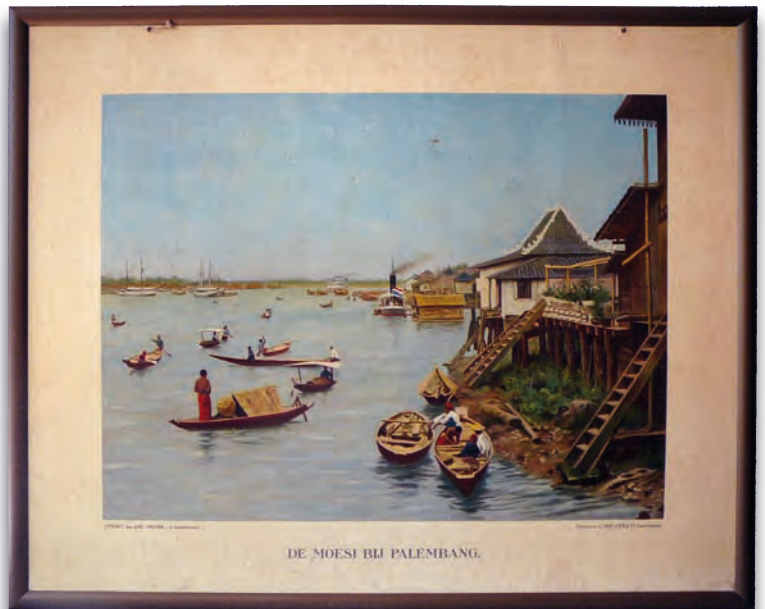
Een ingelijste schoolplaat met een beeld van een rivier op Sumatra.

Veel Bergers zullen eind december 1948 van trots vervuld zijn geweest toen ze de naam van hun plaatsgenoot, schaatser Theo Janmaat, net als in 1947 weer prominent in de landelijke kranten zagen vermeld als winnaar van diverse landelijke kortebaanwedstrijden.