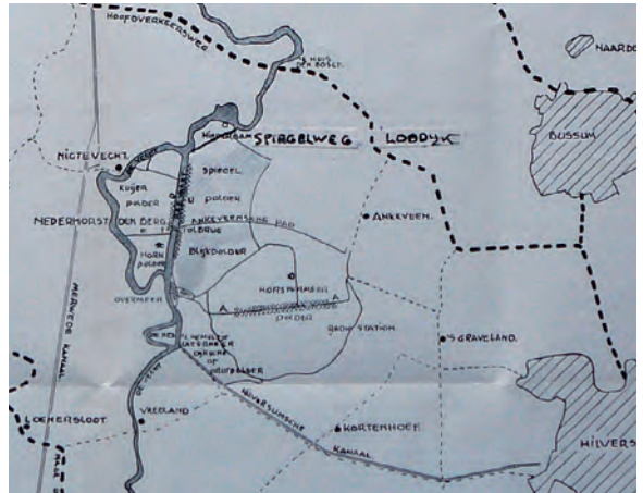
Een kaart van Nederhorst den Berg en omstreken rond 1935. De Spiegelweg (geopend in 1949) is er ingetekend. De kruisjes op de kaart geven de bestrate wegen binnen het dorp aan.

De mondjesmaat beschikbare ruimte kromp in die laatste dagen van de oorlog nog meer omdat veel Horstermeeders met hun gezinnen naar het droog gebleven deel van de gemeente waren gevlucht. In de Warinschool was een noodhospitaal ingericht omdat het dorp totaal van de buitenwereld was afgesneden.