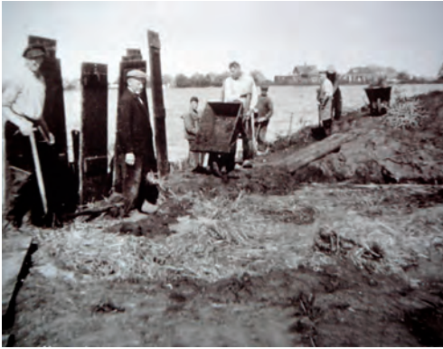
Het gat in de Vechtdijk van de Hompolder wordt onder het toezien van wethouder Welle (met pet) gedicht.

De enige troost was dat onze bevrijders, de Canadezen, toegeswaaid konden worden bij Uitermeer. Zij rukten vanuit Bussum over de Loodijk op in de richting van Amsterdam. Het is maar een paar Bergse jongeren gelukt om tijdig bij de Vechtbrug te komen om de tanks en de legerauto's voorbij te zien komen.