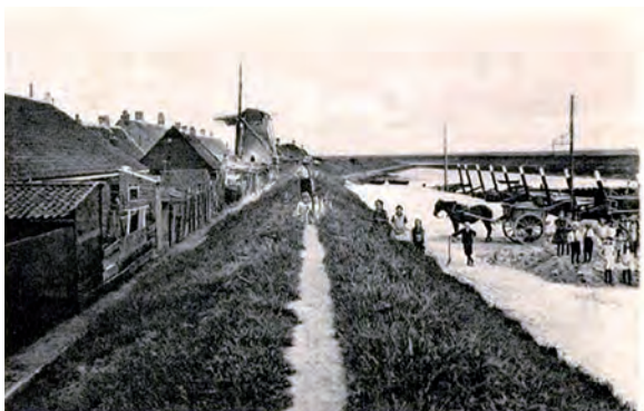
Stavenisse Haven in 1920.