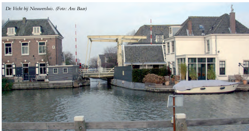
De Vecht bij Nieuwersluis.