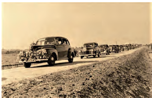
Op naar de Zanderijsluis over de nieuwe Spiegelweg. Links op de foto is de kerktoeren van Nederhorst den Berg te zien.

panen' in met zwaarder materieel. Op de ene foto is hij met zijn trekker ergens in de Horstermeer, onder het toezicht van twee mannen, druk aan het ploegen. Al met al nam de enorme operatie voor de hele streek een flinke tijd in beslag, want volgens onze tractorbestuurder heeft hij wel twee jaar overal geploegd. Op de andere foto is te zien dat het niet altijd meezat. Hier ging het wel heel erg mis! Naar verluid heeft de bestuurder het overleefd. 8)