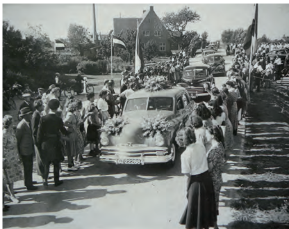
Het halve dorp is uitgelopen om de opening van de Spiegelweg bij te wonen.