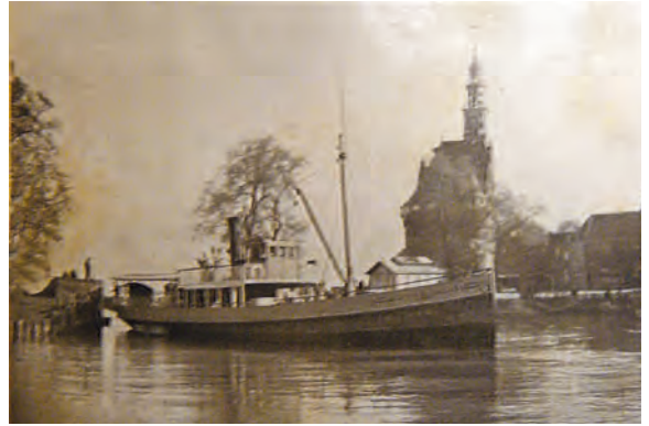
Hoorn-Amsterdam v.v. der N.V. Hoornsche Stoombootrederij, 'Baron van Dedem' berekend op 300 passagiers. Voor deze ene keer voer hij naar Muiden om de Bergers op te pikken.

waarop de mensen uit deze randgemeente van het Gooi naar hier kwamen, ruim twee jaar terug en nu. Destijds bij nacht en ontij, Vluchtend voor het oorlogsgeweld met achterlating van have en goed en met bange zorg in het hart; thans op een mooien Augustusmorgen met de „Baron van