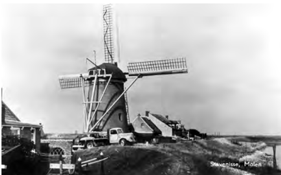
Stavenisser molen met laden en lossen van vrachtauto's in 1920.