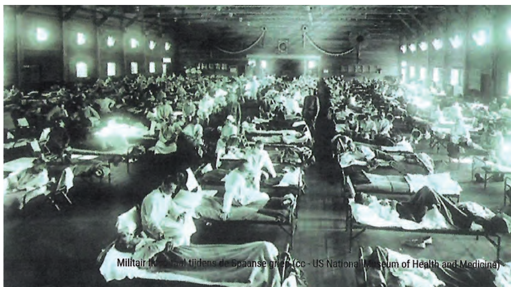
Militair ziekenhuis tijdens de Spaanse griep.

Amsterdam telde 15.000 doden, Weesp een onbekend doch waarschijnlijk aanzienlijk aantal, Amersfoort 150-225 doden, Hilversum