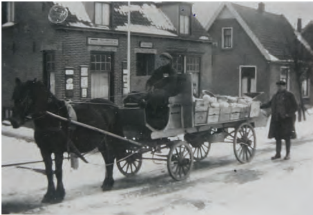
De paardenkar van Nic Versteeg, de groentehandelaar op de Dammerweg.

Zo konden de Duitsers tijdens de razzia van 10 januari 1945 de enige deur van hun huis niet vinden. Zijn vader wilde niet onderduiken zodat hij met een deken om rustig in zijn rookstoel zat te wachten om opgepikt en afgevoerd te worden. Aan de overkant van de Reevaart zag hij bij boer Galesloot de Duitsers op een ladder naar de hooizolder klimmen om te kijken of ze daar ondergedoken mannen vanaf konden plukken.