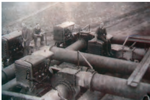
De uit het Twiske aangevoerde hulppompen bij het gemaal van de Horstermeer.

Nadat de gaten in het boezemkanaal met uit Nigtevecht aangevoerde klei waren gedicht