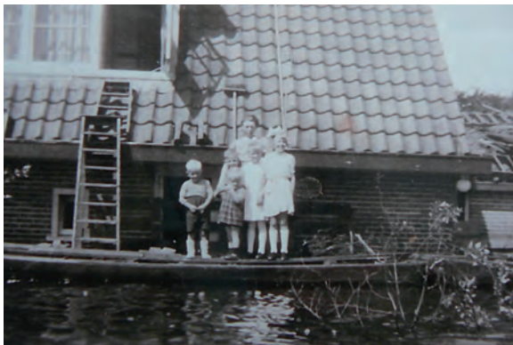
Een paar van de kinderen Kroone mochten, samen met hun moeder, eventjes de buitenlucht in.

kon het malen op 14 mei beginnen. Het gemaal van de Horstermeer had net daarvoor weer stroom gekregen, doch werkte slechts op halve kracht. Gelukkig kreeg het ondersteuning van drie uit Noord-Holland aangevoerde motorpompen die de dag ervoor waren gebracht. Ingenieur van Dalen van Provinciale Waterstaat had er voor gezorgd dat ze in Nederhorst den Berg terechtkwamen. Hij wist dat er in de tijdens de bezetting drooggemaakte Twisepolder nog vier niet meer gebruikte motorpompen stonden.