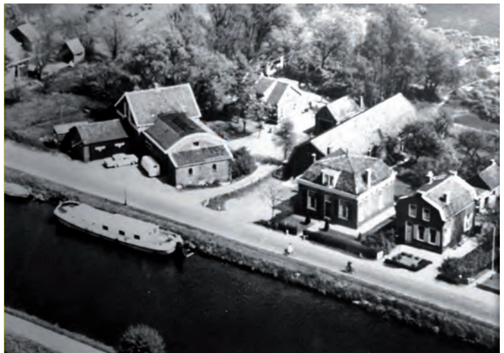
Hier was de Maalderij van Pfeiffer.