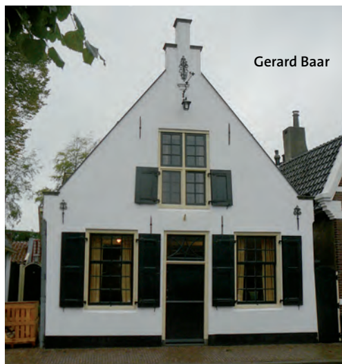
Hetzelfde pand anno 2020.