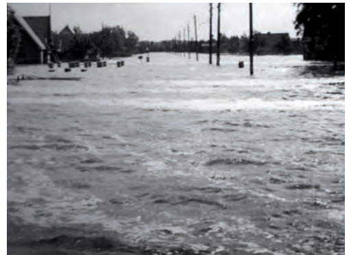
Het water op de Hoofdweg van de Horstermeer wordt opgezweept door de noordewind.

Om maar een voorbeeld te noemen: De leider van de centrale keuken te 's-Graveland was er op 12 juni in geslaagd in Gelderland groente voor de gemeente Nederhorst den Berg te kopen. Om die groente hier te krijgen, vroeg hij aan de burgemeester 50 liter benzine voor de vrachtauto van wasserij