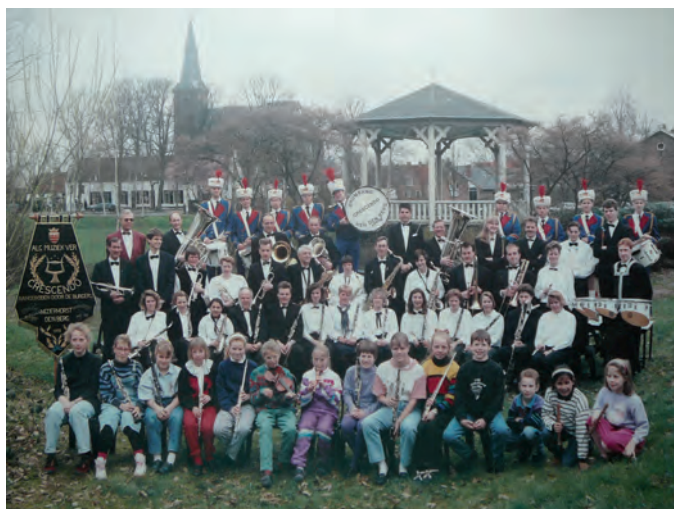
Het voltallige muziekkorps Crescendo begin negentiger jaren bij de muziektent. Het fraaie vaandel is nu in het bezit van de Historische Kring.

De foto onder is genomen begin jaren tachtig. Muziekvereniging Crescendo bestond al sinds 1905. In 2005 vierde zij nog uitbundig haar honderdjarig jubileum. In 2018 kwam er echter noodgedwongen een einde aan deze vereniging die jarenlange bloei had gekend. Aan de lachende gezichten valt af te lezen dat bijna iedereen schik in het maken van muziek heeft. ■