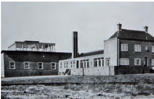
Het radio-ontvangststation Nera net na de oplevering

het Gooi en omstreken deden daar een paar jaar naar ‘hartenlust’ graafwerk in het kader van de werkverschaffing. Twee ‘duwers’ zaten de hele dag fietsen te repareren, zodat de gravers die pech onderweg hadden gekregen toch weer tegen de avond fietsend naar huis konden. De bedoeling was goed, maar het pakte heel anders uit. In plaats van droger was het land door die bewerking natter geworden doordat de percelen veel te groot waren gemaakt. Het project ging helemaal ten onder tijdens de inundatie van de Horstermeer in 1940. Het gebied groeide in de loop der jaren uit tot een woestijn. 11)