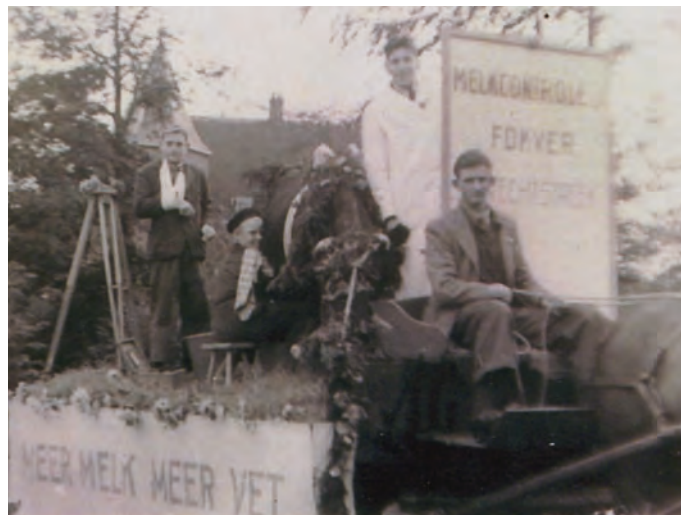
Feest bij de troonsbestijging van Koningin Juliana in 1948.

Later – vooral in de eerste fase na de bevrijding – raakten de vernieuwers steeds meer verdeeld over de koers die gevoerd moest worden. De vurige wens was dat niet de levensbeschouwelijke tegenstellingen de poli-