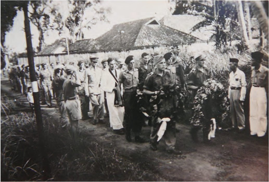
De begrafenis van een gesneuvelde Nederlandse militair.