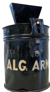
Uit de vitrine.

Nummers van TVE waarin Nederhorst den Berg de hoofdrol speelt en uitgaven van de HKN. (Mocht u oude gedrukte nummers van de Werinon willen hebben dan bent u iedere donderdagavond van harte welkom van half acht tot half tien in het Cultureel Centrum).