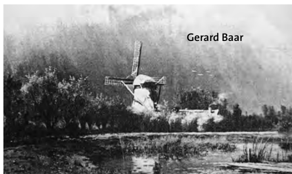
De door Gabriël geschilderde molen aan de Kleizuwe.

hij zijn hele leven getracht een stuk uit de natuur te knippen om het in een lijst te zetten. 1)