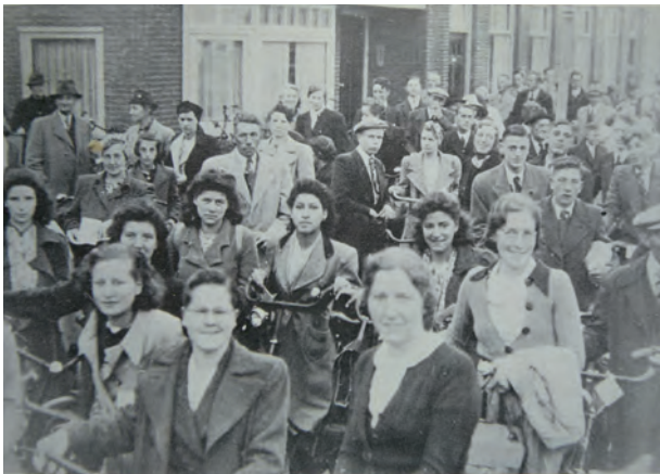
Na de overtocht gaan de Bergers op weg naar de respectievelijke dorpen waar ze onderdak kregen tijdens de evacuatie.

West-Friesland ontving vierhonderd gasten. Evacuatie met muziek aan boord. Het was in de Meidagen van 1940 dat de bevolking van Nederhorst den Berg voor het dreigend oorlogsgevaar moest vluchten en een gastvrij onderkomen vond in West-Friesland, met name in de dorpen rond Hoorn. Bij honderden werden de geëvacueerden hier ondergebracht en in de weken, die zij hier verbleven, vonden velen een vriendelijk tehuis, groeiden vriendschapsbanden. Men heeft West-Friesland, ook toen men weer naar eigen hof terugkeerde, niet vergeten en gisteren is men van zijn dankbaarheid komen getuigen. Met de Hoornsche boot is een vierhonderdtal ingezetenen van Nederhorst den Berg – meer konden er niet worden geborgen – gisterochtend van Muiden naar hier overgekomen om aan de gemeenten Zwaag, Wognum, Wijdenes en Schellinkhout geschenken aan te bieden, een geste, welke wel hoogelijk op prijs werd gesteld. Er was wel eenig verschil in de wijze,