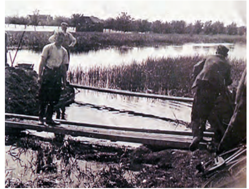
Een van de twee gaten in het boezemkanaal is bijna gedicht.

Naast de noodlottige inundatie lag ook de wasindustrie al vanaf september 1944, ten gevolge van de spoorwegstaking, totaal stil. De volksgezondheid was niet ongunstig, maar er kwam betrekkelijk veel ondervoeding voor, vooral bij kinderen. Op de waslijst aan klachten stond één pluspuntje: de waterleiding functioneerde. Daarentegen was er geen elektriciteit en geen enkele mogelijkheid tot vervoer, want de paar in het dorp aanwezige vrachtwagens konden niet rijden vanwege het gebrek aan benzine. Bovendien versperden tankgrachten de drie toegangswegen. Er zat niet veel vooruitgang in de situatie.