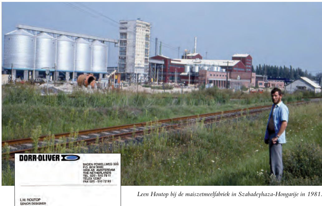
Leen Houtop bij de maïszetmeelfabriek in Szabadeyhaza-Hongarije in 1981.

Hij voelde grote affiniteit met de foodindustrie. Hij ontwierp daarvoor productielay-outs voor fabrieken tot wel 800 ton maïs voor landen als Roemenië, Hongarije, Finland, Argentinië en op meerdere plaatsen in China. Schepen, vrachtwagens en spoorwagens zorgden voor een constante stroom aan maïskorrels. Deze zijn niet alleen rijk aan zetmeel,