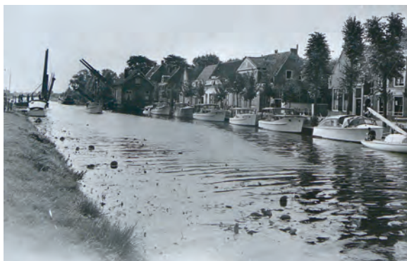
1956. De welvaart is al wat toegenomen, zoals u ziet...

N.B. Dit artikel is mede tot stand gekomen door de bewaard gebleven archiefaantekeningen van de in 2011 overleden Jan Baar. Tevens is dit artikel in iets andere vorm eerder gepubliceerd in het Tijdschrift voor regionale geschiedenis ‘Tussen Vecht en Eem’.