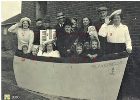
Waarschijnlijk gemaakt voor een voorstelling van de Horstermeerse toneelvereniging.

overde vanaf die tijd langzaam terrein. De Nederlandse regering begon zijn bevolking er op te wijzen dat het heel lang zou duren voor er welvaart zou komen als we met zovelen bleven. Eerst vertrokken de mensen die bang waren voor het rode gevaar naar respectievelijk Canada, Australië of Nieuw-Zeeland. Daarna volgden grote gezinnen waarvan de ouders zich een betere toekomst voor hun kinderschaar wensten. Die propaganda van de overheid heeft lang niet altijd goed uitgedrukt. Er zijn emigranten geweest, vooral vrouwen, die hun hele verdere leven enorme heimwee hebben gehad. Als hun mannen net als zij terug wilden, kon dat niet omdat ze te arm waren. In de brieven naar huis schreven ze desondanks enthousiast over hun nieuwe vaderland om hun familie niet ongerust te maken.