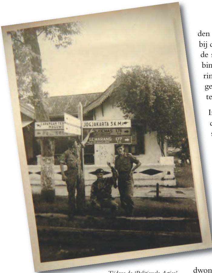
Tijdens de 'Politioene Acties'.

nacht het erf van de boer op zagen rijden en het zaag- en boorgeluid in de boerderij stopte. Door een slimme overrompelingstactiek werden de clandestiene slachters in een hinderlaag gedreven.