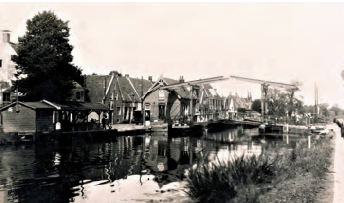
Het centrum van Nederhorst en Berg van voor en eigenlijk ook van na de oorlog als u de twee torentjes weg denkt die u tussen het rechtergedeelte van de ophaalbrug ziet. Die zijn van het in 1936 gesloopte gesticht van de Zusters van de Voorzienigheid. De rest is heel lang hetzelfde gebleven.

inherent aan het feit dat hun ouders in het verleden ook al het risico genomen hadden alles achter zich te laten om hier een nieuw leven te beginnen. De Horstermeer lag vroeger mijlenver weg voor die immigranten uit West-Friesland en Friesland. De vereiste moed om het ongewisse leven overzee te tartten, hadden de vertrekkende kinderen misschien meegekregen van hun pas in het begin van de twintigste eeuw naar Nederhorst den Berg geïmmigreerde ouders.