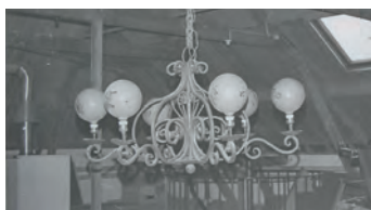
Boven: Voor de gemeente Zwaag, een smeedijzeren lamp. (nu op zolder), rechts: voor de gemeente Wognum, een staande klok. Onder: De plaquette voor de bank.