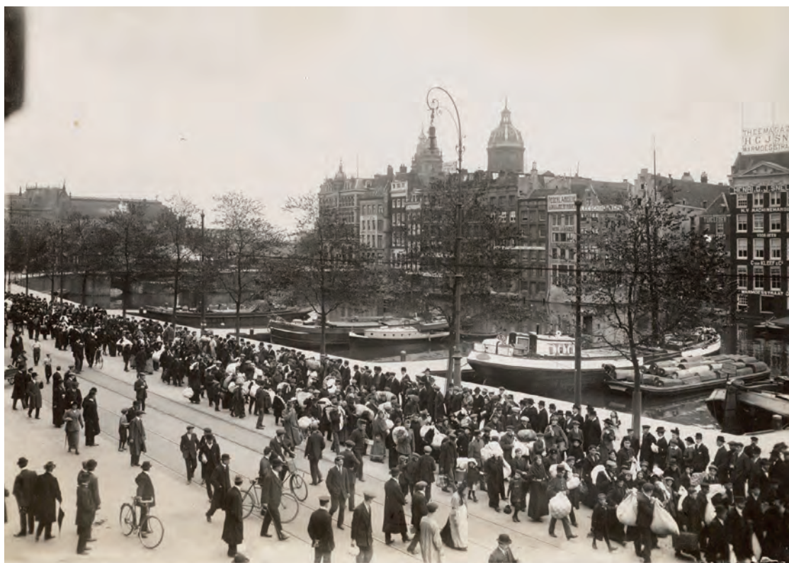
Aankomst Belgische vluchtelingen in Amsterdam.

en in korte tijd was de gehele omgeving besmet. Maar de aanvoer van militairen uit Amerika ging gewoon door.