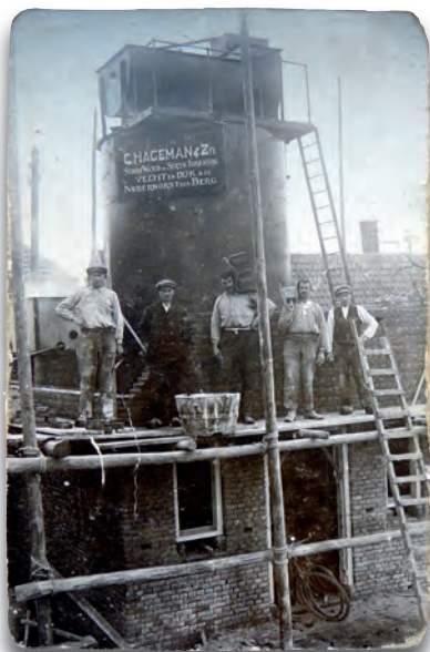
Er wordt gewerkt bij waterrij C.C. Hageman (Vecht en Dijk)

Begin juli was de hele Horstermeer eindelijk weer zo goed als droog. De boeren en tuinders konden met opruimen beginnen. Het land droogde door aanhoudend mooi weer verbazend snel op. Zodra het kon begon iedereen te spitten om later in het jaar nog wat te kunnen oogsten. Na taxatie bleek de geleden schade zo'n 1.500.000 gulden te bedragen. Voordat de tuinders aan de slag konden was er elders in het dorp al het een en ander in gang gezet. Van de stilstaande waterrijen kon Vecht en Dijk als eerste beginnen omdat ze september 1944 hun voorraad kolen op de akker hadden ingegraven. Het bedrijf kreeg ter compensatie van haar gevorderde auto's een leger-