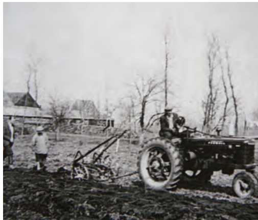
Een moment van onoplettendheid of een bezweken toegangsbrug? Westland ploegt met behulp van een Amerikaanse tractor een stuk grond ergens in de Horstermeer.

zand was opgespoten. Doordat het wel tot 1948 duurde voordat de ABM het opgezogen zand naar de stadsuitbreidingen van Amsterdam af kon voeren, ontstond er een heus duinlandschap in die hoek. In de zomervakanties was het een eldorado voor de Bergse jeugd. De ABM nam steeds meer Bergers in dienst, zodat het bedrijf voor een deel meewerkte aan de oplossing van de grote werkloosheid in de gemeente. In de Pijler van 11 maart 1977, het periodiek van de Ballast, staat een artikel over de huldiging van 50 jubila-