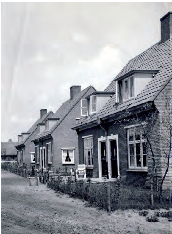
De eerste naoorlogse nieuwbouw aan de Vreelandseweg in Overmeer. Waar links het riet gedekte staat zou een paar jaar later de eerste straat komen (Kastanjelaan)

In 1924 kreeg Nederhorst den Berg voor het eerst woningen in de sociale sector. Het betrof het in 1980 afgebroken Rode Dorp aan de Overmeerseweg dat een stukje in de diepte lag vanaf de Overmeerseweg gezien. Aan de voorzijde beschikten de bewoners over grote moestuinen. Iedereen had in die jaren wel een moestuin, maar de Rodebuurt-